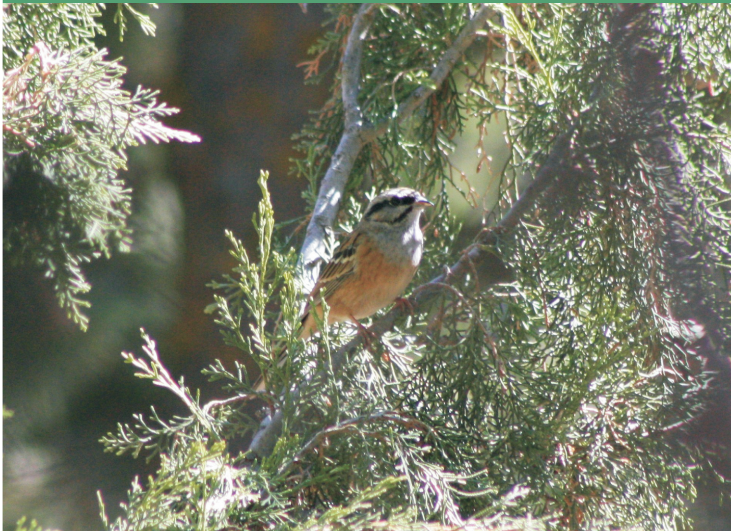
Escribano montesino en un ciprés