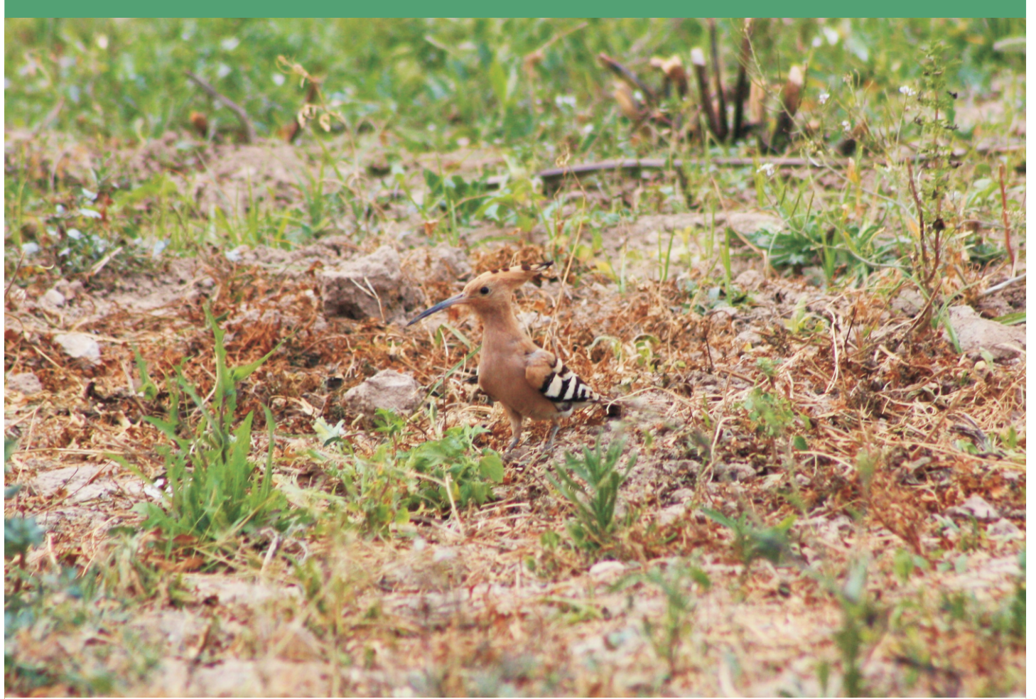
Abubilla buscando insectos en un herbazal