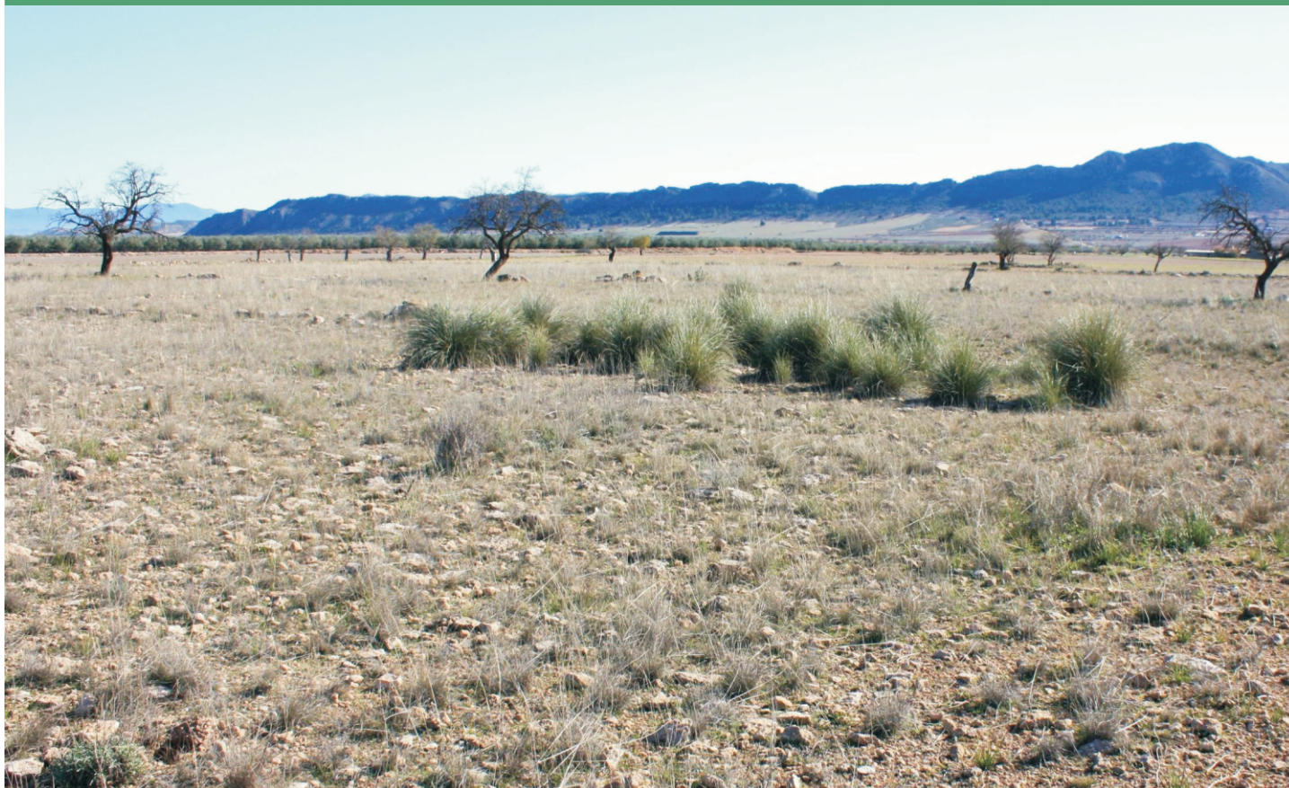
Hábitat estepario en el que aparece el sisón