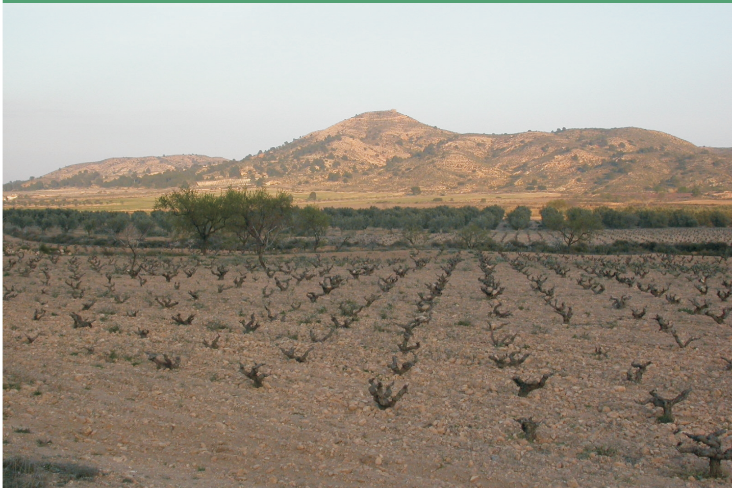
Uno de los hábitats agrícolas donde aparece el alcaraván