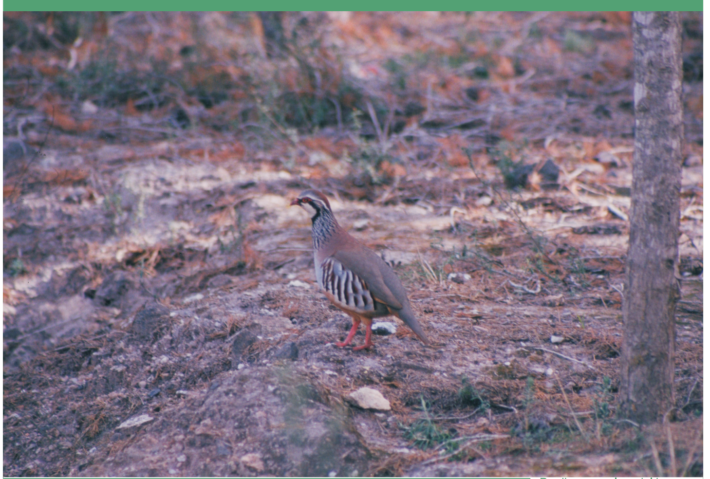
Perdiz en un claro del bosque