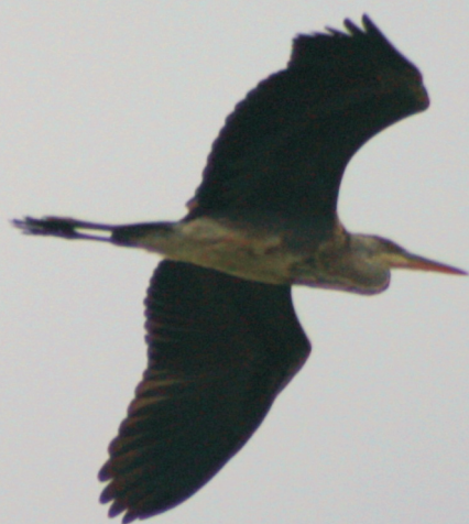
Garza real en vuelo