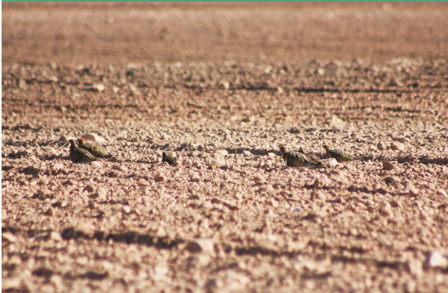
Gangas en terreno labrado