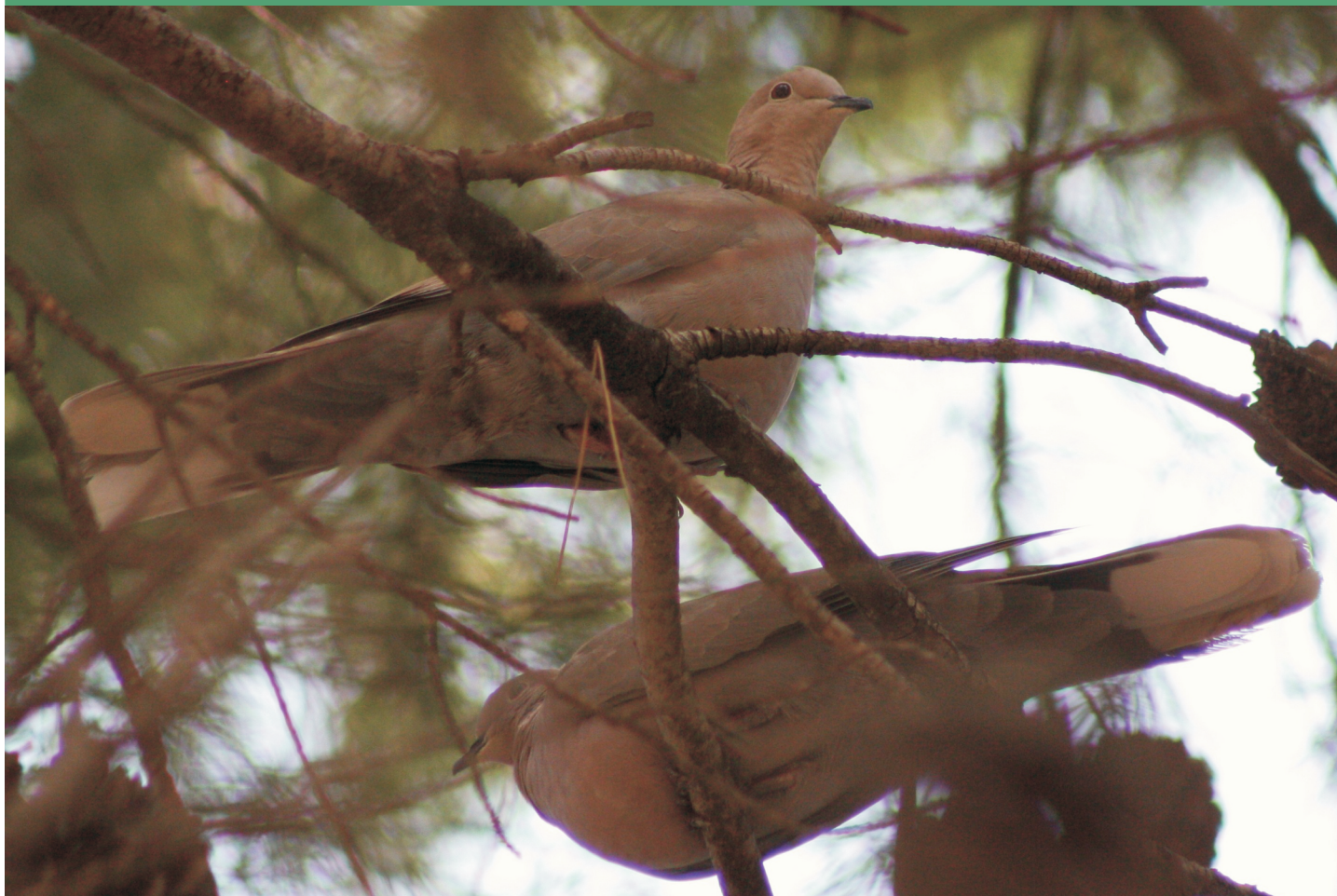
Pareja de tórtolas turcas en pino carrasco