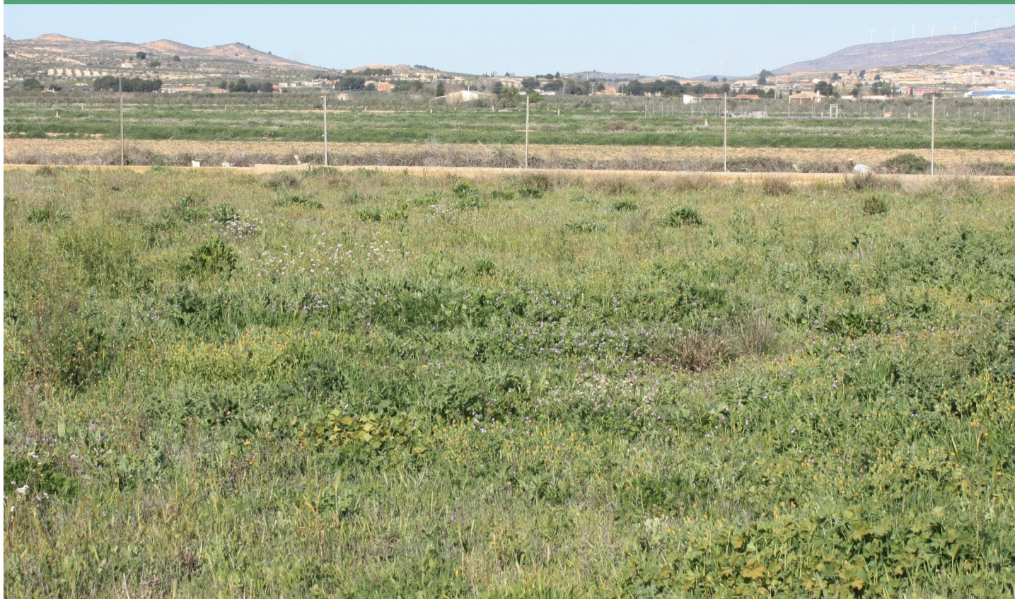
Uno de los hábitats herbáceos donde aparece el triguero