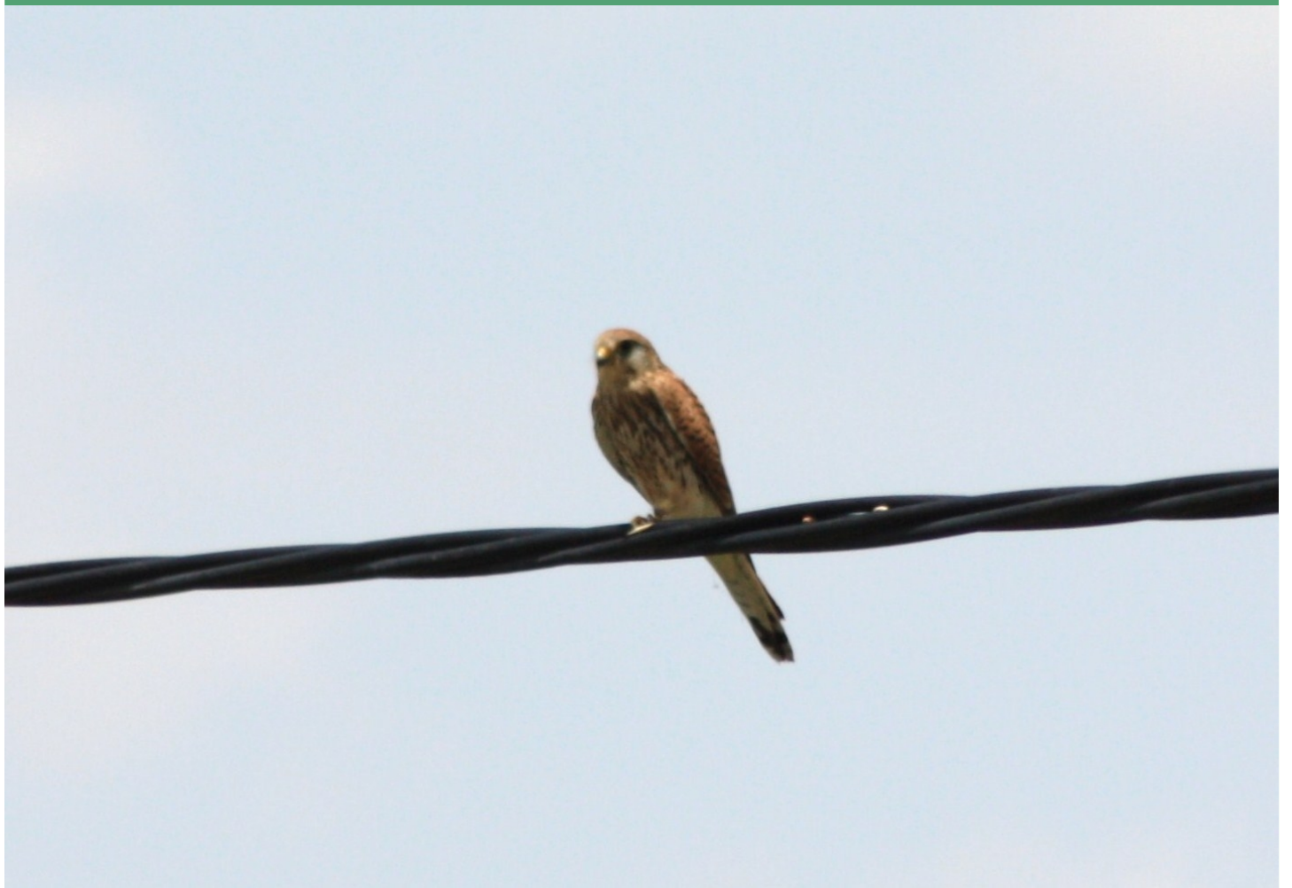
Cernícalo posado en cable