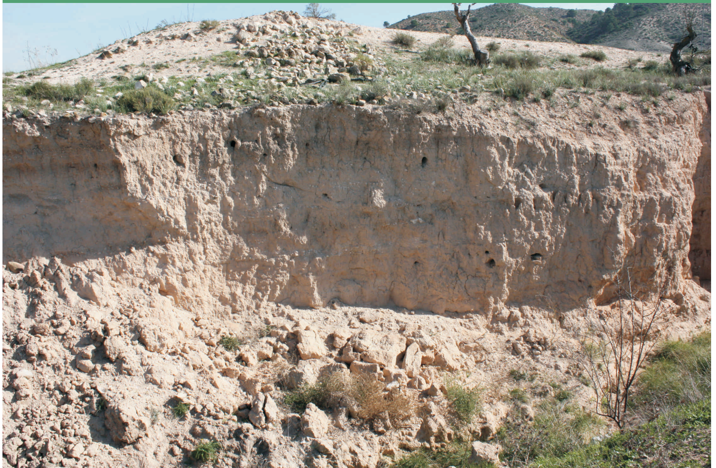
Talud de cría de abejarucos