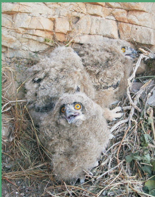
Pollos de búho real

Si nos centramos en cada ambiente presente en el término, entre las aves rupícolas, asociadas a los roquedos de las sierras, habría que destacar a las rapaces, como el águila real, el halcón peregrino o el búho real, pero hay otras aves también muy ligadas a este medio como el cuervo, la chova piquirroja, el roquero solitario, el avión roquero o el vencejo real.