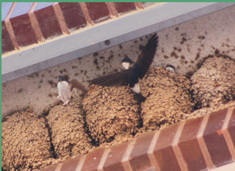
Aviones comunes en sus nidos

Por último, también las aves de áreas urbanas o de zonas habitadas se recogen entre las inventariadas, figurando entre ellas quizá las más conocidas por los habitantes del pueblo de Caudete: el avión común, el vencejo común, la tórtola turca, la golondrina común o el gorrión común.