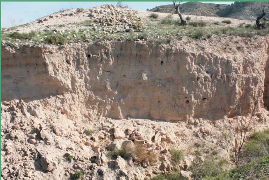
Talud de cría de abejarucos

Primeramente centré los esfuerzos en el paraje de "La Toconera" (hace ya casi 20 años), junto con la Sierra Lácer y los campos cultivados periféricos, para posteriormente extenderlos al resto de sierras y llanuras del término municipal. Conforme aumentaba el número de salidas de campo y de parajes prospectados lo hacía el de especies encontradas. Así, desde las 31 especies de aves recogidas en un primer inventario en la Toconera (Cremades 1996) se pasa a 42 especies dos años después (Cremades 1998) y a 57 en otra recopilación en la misma zona (Cremades 2001), y desde las 81 especies inventariadas por todo el término (Cremades 2004) se pasa al centenar recogido hasta la actualidad.